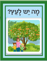
מָה יֵשׁ לַעֲץ?